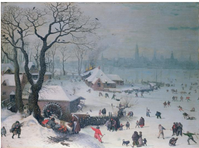
Winterlandschaft bei Antwerpen mit Schneefall, 1575

Endlich hat es auch bei uns geschneit und wir haben die Möglichkeit uns in der weißen Pracht zu vergnügen und Schlitten zu fahren. Auch die Menschen in früheren Zeiten fanden schon Gefallen an winterlichen Aktivitäten. Auf einem Bild des Malers Lucas van Valckenborch, das vor mehr als 400 Jahren gemalt wurde, zeigt dieser uns, welche Möglichkeiten es damals für Kinder und Erwachsene gab.